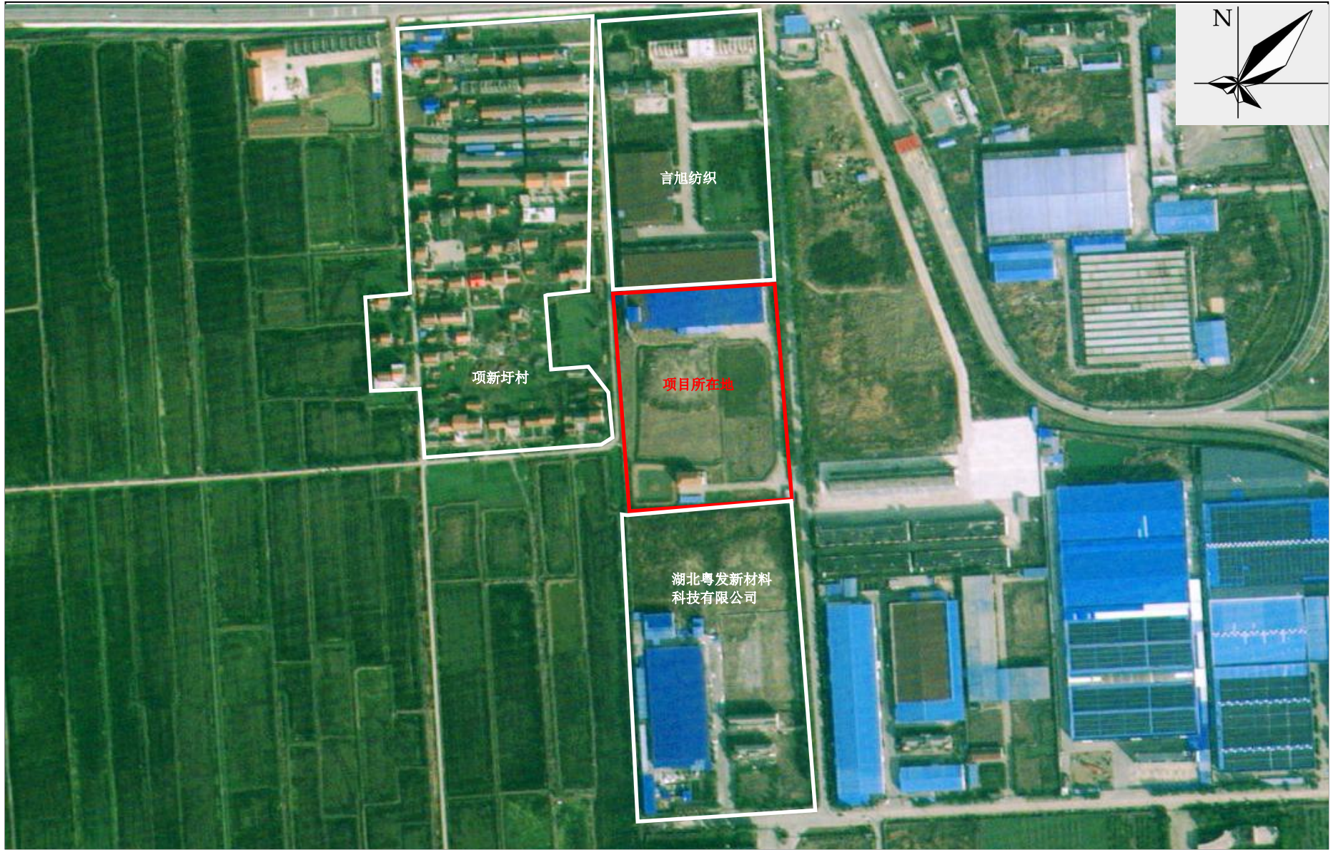
附图 2 项目周边关系示意图