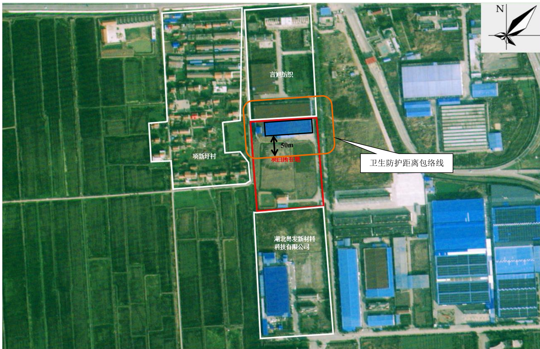
附图 5 项目卫生防护距离包络线图